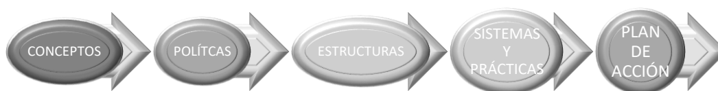
Figura 1. Estructura Guía Iberoamérica Inclusiva.

La primera, Iberoamérica inclusiva - Guía para asegurar la inclusión y la equidad en la educación en Iberoamérica , es una adaptación del documento originalmente publicado por la UNESCO en 2017: Guía para asegurar la inclusión y la equidad en la educación . Fruto de la más reciente colaboración UNESCO-OIE, el grupo de expertos involucrados conciben la guía como un instrumento de apoyo para la revisión, el desarrollo, la implantación y el monitoreo de políticas y prácticas inclusivas encaminadas a generar cambios sistémicos que ayuden a superar diversos tipos de obstáculos que impiden desarrollar y lograr una educación de calidad. La guía propone un marco de revisión a partir de 4 dimensiones: conceptos, políticas, estructuras y sistemas y prácticas.