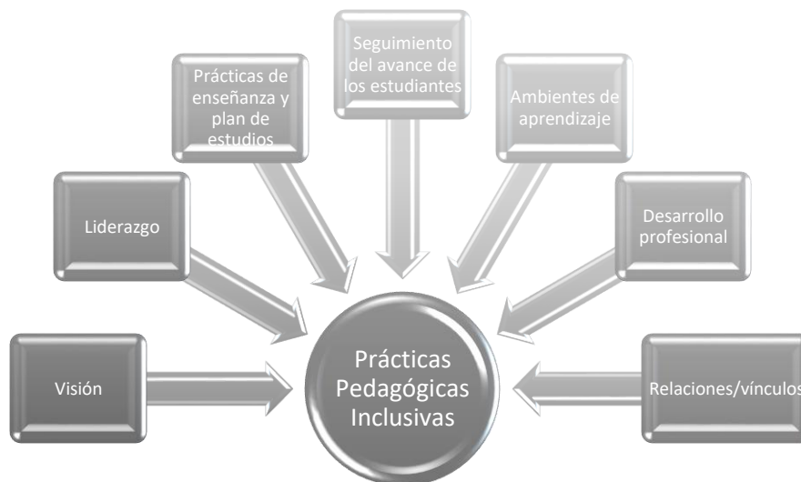
Figura 2. Estructura Guía GIPP.

permite evidenciar como las prácticas responden a la diversidad de los estudiantes. La herramienta se adaptó para el contexto colombiano a partir de la Guía de indicadores de New Brunswick , provincia rural y pequeña de Canadá en donde a partir de 1986 se desmanteló el sistema de educación especial y se inició un proceso de atención a la diversidad en las escuelas locales. Los autores conciben la guía como un instrumento que permite identificar experiencias que reflejen indicadores de una práctica pedagógica inclusiva y de calidad. La guía establece 7 dominios: