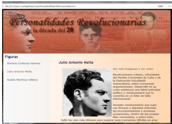
Figura. 2. Página Web Personalidades Revolucionarias de la década de 1920

Este recurso aborda el quehacer de tres figuras jóvenes que marcan el desarrollo de la década de 1920 en Cuba: Rubén Martínez Villena, Julio Antonio Mella y Antonio Guiterras Holmes. Posee enlaces a tres materiales audiovisuales, uno de cada personalidad, Figura 3, y a una galería de imágenes, que complementa lo expresado en el texto que se ofrece y portarse en un dispositivo de almacenamiento. Por sus características puede ser utilizado por el profesor en el momento de la clase que lo determine: asegurando el nivel de partida, como parte del contenido a impartir o como actividad a consultar para el trabajo independiente orientado y evaluarse respondiendo el cuestionario que se ofrece sobre el tema.