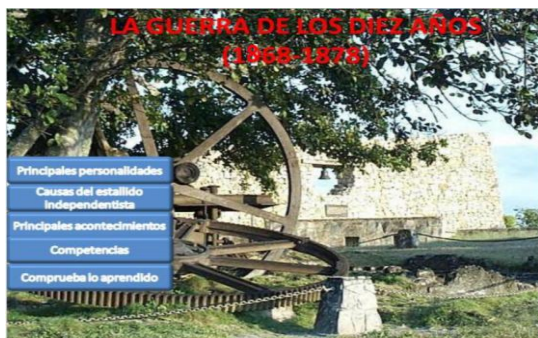
Figura. 2. OA Guerra de los Diez Años

Estos principios conduce a plantear que la utilización de los REA, como medios del proceso de enseñanza-aprendizaje desarrollador de la asignatura Historia de Cuba, es significativa, sobre todo, por la variedad de medios de enseñanza que resultan del desarrollo científico-técnico, la significación que estos adquieren al tener que confiarles el contenido y los entornos donde se produce la acción educativa, y su carácter sistémico, que posibilita tomar decisiones sobre su utilización en la clase. Figura 2