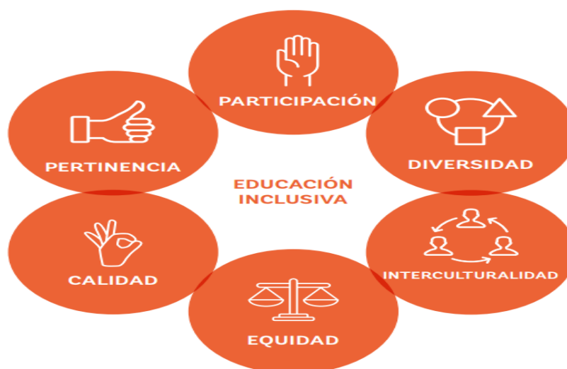
Figura 2 Características de la educación inclusiva. Tomado de Índice de inclusión para educación superior- INES, 2017, p. 19. Desde Lineamientos. Política de educación superior inclusiva. Ministerio de Educación Nacional. Bogotá, Colombia, 2013.

En Antioquia, juega entonces un papel importante la premisa de una educación de calidad dentro del contexto colombiano, donde la era digital se convierte en una alternativa para superar los espacios presenciales, donde los Ambientes Virtuales de Aprendizaje permiten articularse a los planes de gobierno desde el acceso, la permanencia y la graduación a partir de la educación virtual, para zonas remotas del país y que son punto de partida con factores de inclusión, que conllevan a oportunidades de mejora en la calidad de vida de estas regiones, proporcionadas por la IES de Antioquia, que no desconocen la concentración de pobreza en las zonas rurales, en las cuales habita el 30,3% de la población del país, y donde el 75% de la población vive con menos de un salario mínimo, es decir poblaciones vulnerables (Índice de inclusión para educación superior- INES, 2017, p. 15). Por lo que las IES de Antioquia le apuntan a los siguientes aspectos expresados en la siguiente figura (figura 2).