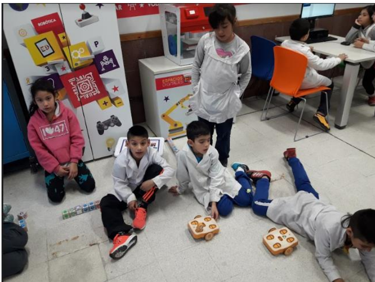
Captura de experiencia con tercer grado donde el espacio se distribuyó para trabajar en dos actividades, esto permitió que el acceso e interacción con los Kibo y la programación en pilas bloques pudiera ser trabajada equitativamente

de las prácticas de enseñanza en el aula desde sus dispositivos celulares, gracias a estos registros se pueden analizar estrategias que se dan en el grupo del aula para resolver desafíos planteados, cómo se organizan, de qué forma se comunican y cómo se conforman los poderes para tomar decisiones. Hemos observado que han creado roles para operar los periféricos cuando se propone el trabajo grupal en las computadoras de escritorio potenciadas, a diferencia de la forma de operar las computadoras individualmente, los roles se dividen en teclado, colaboradores y mouse. trabajan por turnos y por tiempos. Estas observaciones nos ayudaron a crear secuencias para dar oportunidad a quienes tienen pocas opciones de operar la computadora o de tener voz en las decisiones para realizar un ejercicio con su grupo. Las experiencias logradas en esas intervenciones en las secuencias, dinamizó y niveló las oportunidades de participación y aprendizaje.