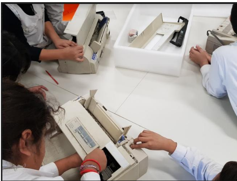
Captura del momento en que el grado desarma y clasifica los componentes de las impresoras

Un concepto provocativo que resulta convergente, es el de “desobediencia tecnológica”, que refiere a intervenir y manipular tecnología para utilizarla con fines distintos para los cuales fue creada. Tenemos experiencias muy interesantes bajo este concepto, rescato el abordaje al conocimiento de los mecanismos como contenido curricular en la materia de tecnología para 5to grado, proponiendo el desarme de impresoras para clasificar y utilizar sus componentes en otras aplicaciones, esta intervención, posibilitó el uso de herramientas, la observación crítica, las preguntas, la clasificación y análisis de componentes y el diseño preliminar de modelos para crear mecanismos propios. Estos saberes son aprovechados para recrear dispositivos que cuenten historias inspiradas en las obras literarias que se leen en el aula.