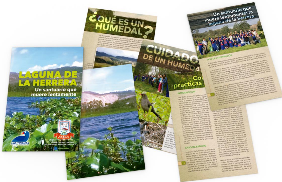
Figura 4. Cartilla Laguna de La Herrera. Elaboración propia.

Otro resultado del aprendizaje de los estudiantes, se evidencia, no sólo en el nivel conceptual logrado, sino también su creatividad, la cual se patentizó en el desarrollo de actividades tales como la elaboración y producción de una cartilla con su correspondiente socialización a la comunidad educativa, en donde se muestran los principales servicios ecosistémicos del humedal y los factores de contaminación que padece el mismo en la actualidad ( https://issuu.com/lagunadelaherrera/docs/cartilla_tinguas ) (Figura 4).