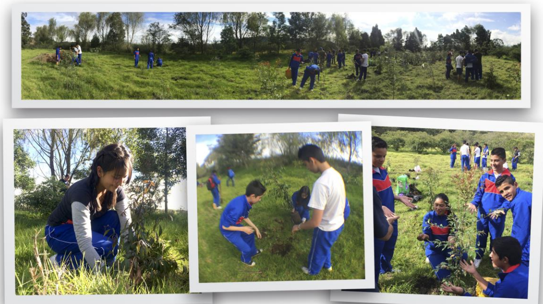
Figura 3. Campañas de Reforestación Laguna de la Herrera. Elaboración propia.

La interacción con la aplicación ha generado un impacto positivo en la comunidad educativa, la cual se evidencia en campañas de reforestación que se han llevado a cabo en el Humedal, dando como resultado la siembra de 800 árboles en los dos últimos años, asumiendo que el efecto de su función ha reducido la huella de carbono y ha mitigado los efectos de la contaminación física y química que padece el ecosistema (Figura 3).