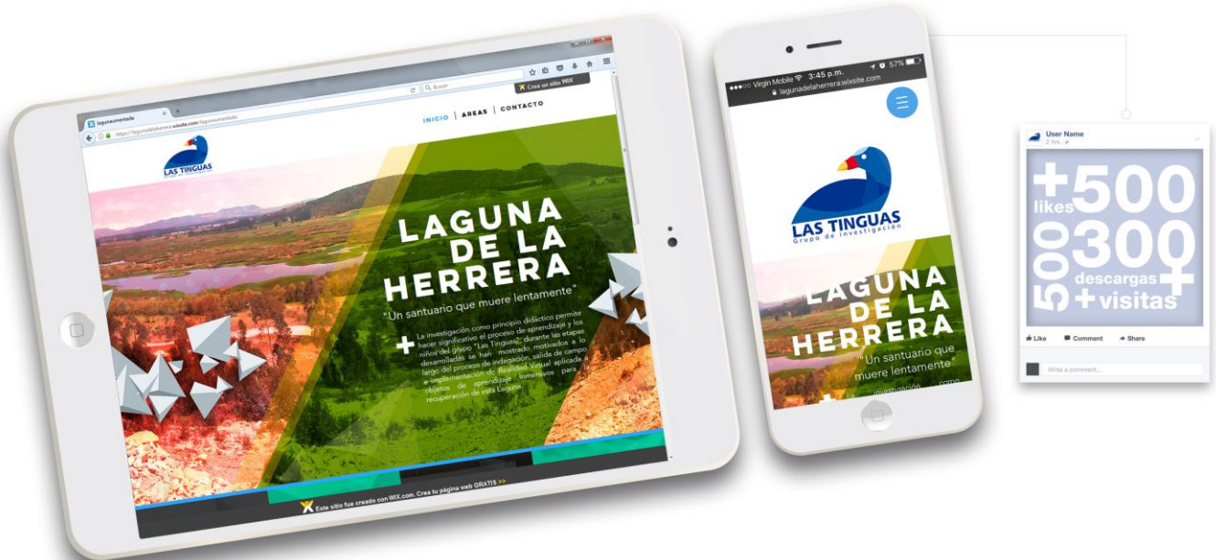
Figura 2. Sitio WEB Laguna de la Herrera. Elaboración propia.

Los integrantes del colectivo de investigación produjeron un prototipo que configura un ambiente virtual compuesto de elementos, interacciones y características de la Laguna de la Herrera. Su difusión a los miembros de la comunidad educativa y a los habitantes de los municipios de Madrid y Mosquera, dan cuenta de las visitas que hasta la fecha se han realizado a la página web https://lagunadelaherrera.wixsite.com/lagunaumentada (Figura 2).