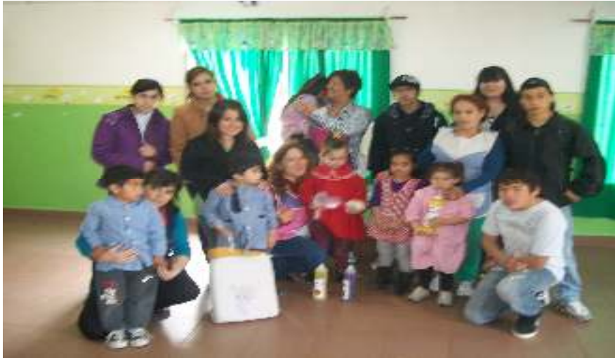
Planificación de salidas grupales y distribución de los productos en instituciones barriales como el jardín maternal, escuelas de nivel inicial y primario y comedor comunitario.