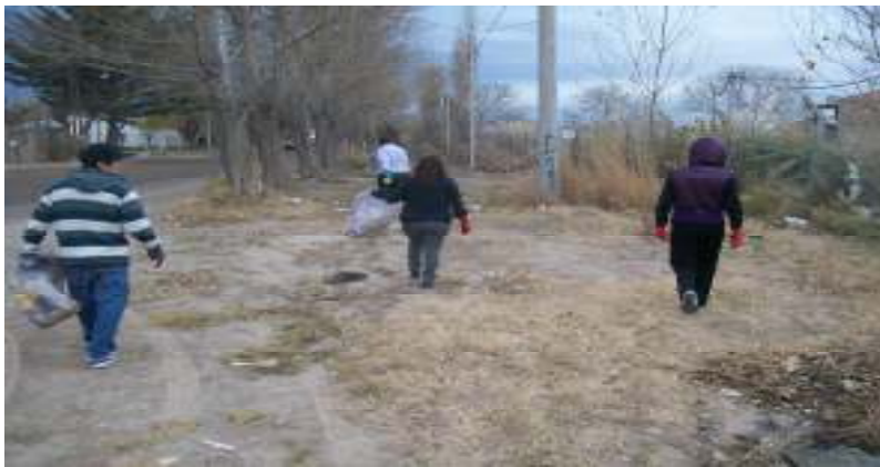
Puesta en marcha de las campañas de recolección y acopio de envases vacíos en la vía pública.