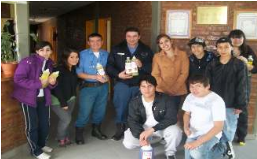
Visita y distribución de productos en el destacamento policial del barrio.