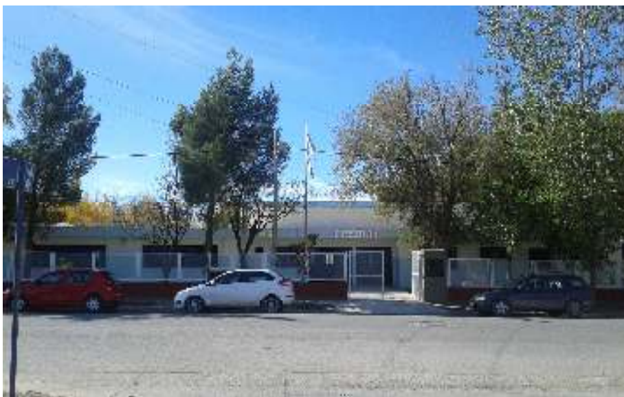
Centro Provincial de Educación Media N° 49. Barrio Valentina Sur. Neuquén capital.

El presente proyecto de innovación en el aula, refiere a la metodología de abordaje de contenidos interdisciplinarios desde el desarrollo de un proyecto didáctico-productivo-solidario, encuadrado en la modalidad de Aprendizaje Basados en Proyectos (ABP) . Se trabajó en forma integrada y coordinada con las áreas de ciencias físico-químicas; medios de comunicación; informática y Ciencias biológicas en la fabricación de productos de limpieza, envasado y distribución en instituciones barriales de la comunidad educativa del Centro de Educación Media N° 49 de Neuquén capital, siendo el objetivo central el de disminuir los altos índices de deserción y abandono escolar . Previo a ello, se desarrolló un exhaustivo trabajo de diagnóstico institucional y detección de necesidades sociales de las familias y los alumnos en situación de riesgo pedagógico a partir de año 2012 al presente ciclo lectivo.