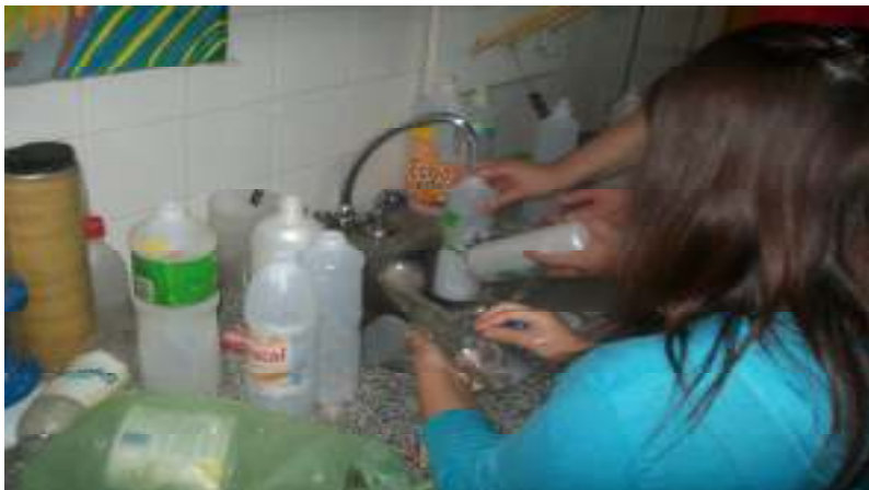
Acondicionamiento de los envases recolectados.

El Centro Provincial de educación Media (CPEM N° 49) pertenece al ámbito estatal, laico, mixto y de jornada simple y con dos turnos, aunque los alumnos asisten en contra turno para desarrollar tareas en talleres, clases de educación física y actividades sociales.