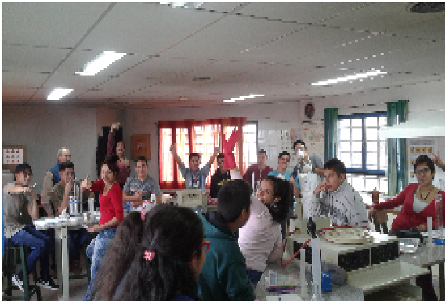
Trabajo de planificación y ensayos con uno de los grupos de alumnos.

Humanos: Docentes titulares o interinos del establecimiento de las áreas de Ciencias físico-químicas, informática, medios de comunicación y de Ciencias Biológicas, con el máximo posible de hs. Cátedra en el CPEM N°49 entre ambos turnos.