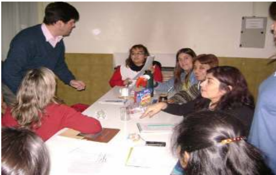
Reuniones de docentes y responsables del proyecto y referentes barriales. Planificación de las tareas.