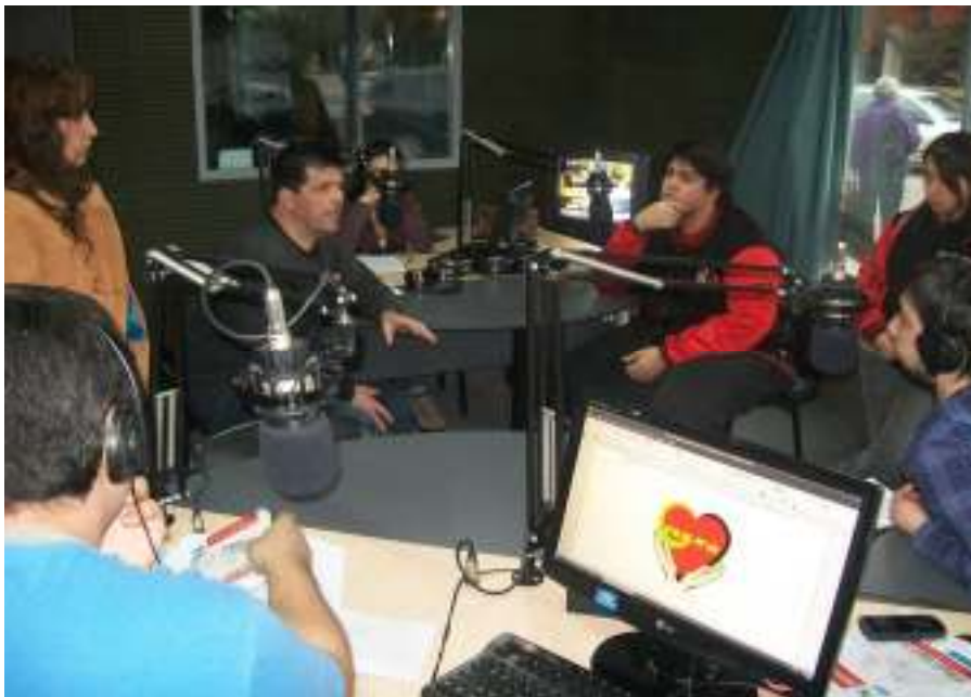
Promoción y difusión de los alcances del proyecto en los medios de comunicaciones locales.