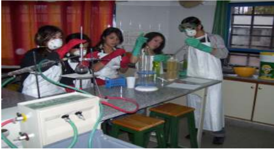
Plena tarea de fabricación de los productos de limpieza en laboratorio.